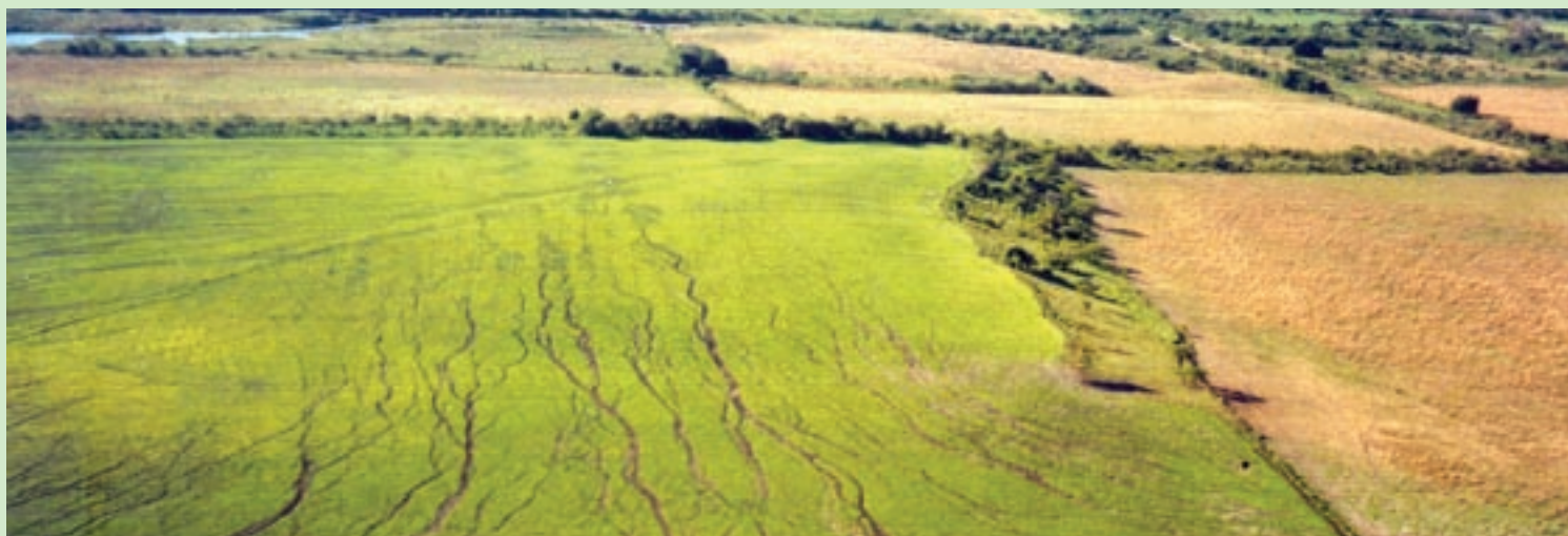
Dans les Pampas, des ruisselets se forment pendant les orages pluvieux lorsque la couverture végétale est clairsemée et se transforment peu à peu en ravins d'érosion.